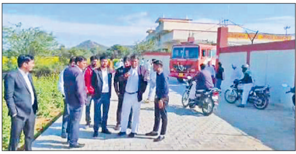
नांगल चौधरी। तहसील कार्यालय के वाहनों की भीड़ में फंसी फायर ब्रिगेड गाड़ी और रास्ते में खड़े वकील।

तहसील कार्यालय को पंचायत समिति के कंडम भवनों से निकालकर दमकल विभाग के भवनों में स्थापित कर दिया। यहां विभागीय कामकाज शुरू होते ही संकरे सड़क मार्ग पर वाहनों की लंबी पार्किंग हो गई। साथ ही प्रांगण में बाइकों की भी और खोखों व वकीलों के चेंबर स्थापित होने से फायर ब्रिगेड का रास्ता बाधित हो गया। शुक्रवार को दमकल विभाग ने कर्मियों ने फायर ब्रिगेड को रन करके रास्ते का अवलोकन किया है, किंतु वाहनों की भीड़ से वाहन को