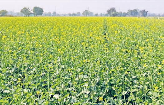
रेवाड़ी। एक खेत में लहलहाती सरसों की फसल।

अनुसार आगामी सप्ताह में आसमान में आंशिक बदल छा सकते हैं। तापमान में उतार-चढ़ाव लगातार बना रहने की संभावना है। शुक्रवार को अधिकतम तापमान 27 डिग्री सेल्सियस रहा, जबकि रात का तापमान 1.2 डिग्री की कमी के साथ 5.6 डिग्री सेल्सियस दर्ज किया गया। दिसंबर माह का पहला पखवाड़ा बीत जाने के बाद तक बारिश भी नहीं हुई है। सुबह और शाम के समय ही ज्यादा ठंड का अहसास होता है। मौसम विभाग के अनुसार इस सप्ताह भी