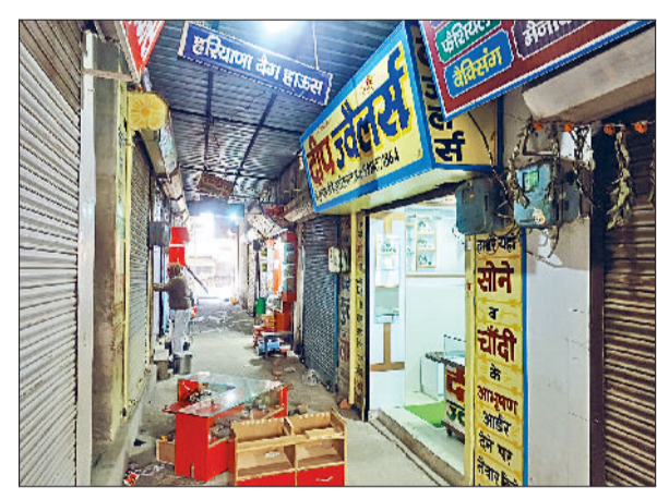
रेवाड़ी। दुकान के बाहर बिखरा पड़ा सामान।

जहां डॉक्टरों ने महेश को मृत मुख्तार के बयान 19 लोगों के घोषित कर दिया। पुलिस ने खिलाफ केस दर्ज किया था।