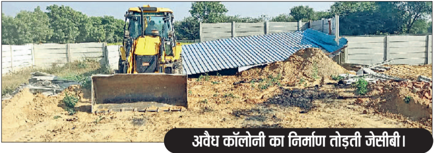
अवैध कॉलोनी का निर्माण तोड़ती जैसीबी।

डीटीपी विभाग की टीम ने शुक्रवार को बावल क्षेत्र में रेवाड़ी-शाहजहांपुर रोड, नैचाना व गांव कालड़ावास की राजस्व सीमा में अवैध रूप से विकसित की जा रही तीन कॉलोनीयों व अवैध निर्माणों पर एक्शन लिया। पुलिसबल की मौजूदगी में डीटीपी की कार्रवाई का कहीं विरोध नहीं हुआ। डीटीपी की लगातार कार्रवाई के बाद भी कॉलोनाइजर व डीलर नई कॉलोनीयों विकसित करने में लगे हुए हैं। डीटीपी के निर्देश पर शुक्रवार को पुलिसबल व ड्यूटी मजिस्ट्रेट के साथ टीम रेवाड़ी-शाहजहांपुर रोड स्थित नरसिंहपुर गढ़ी में पहुंची। जहां डीटीपी की टीम ने करीब 2 एकड़ जमीन पर विकसित की जा रही अवैध कॉलोनी में बने हुए निर्माण, ग्रीन बेल्ट में 4 अवैध निर्माणों व अवैध निर्माणों पर सीलिंग की कार्रवाई की। इसके अलावा डीटीपी की टीम ने गांव नैचाना की राजस्व सीमा में करीब 4 एकड़ जमीन पर विकसित हो रही अवैध कॉलोनी को ध्वस्त किया।