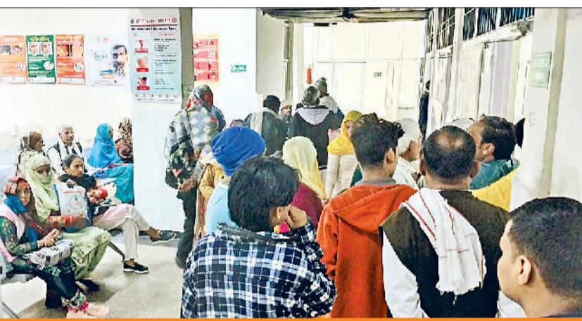
नागरिक अस्पताल में आंखों की ओपीडी के बाहर लगी भीड़